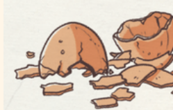
Coquilles écrasées (œufs, noix...)