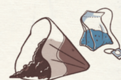
Marc de café sachets de thé