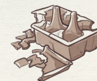
Boîte à œufs en carton

Si vous avez un jardin, pensez à ajouter dans le composteur les tailles de haies et branchages broyés, les tontes (en petite quantité) et les feuilles mortes.