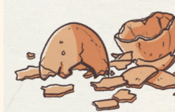
Coquilles écrasées (œufs, noix...)